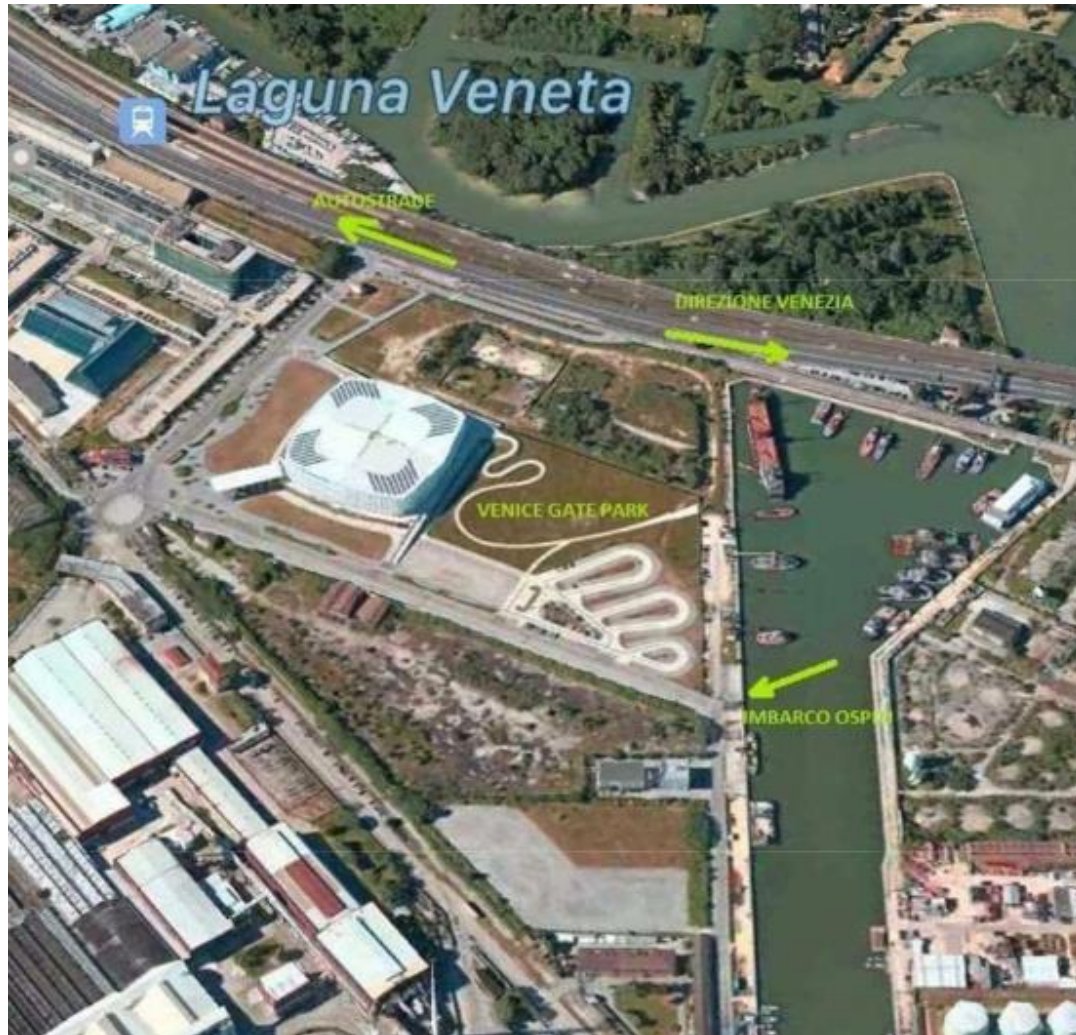
VENICE GATE PARKING - Via Galileo Ferraris

Tramite Autostrada A1 fino a Bologna poi in A13 Bologna - Padova e infine in A4 Padova - Venezia.